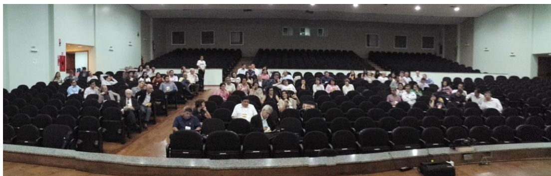
Anfiteatro da UFGD